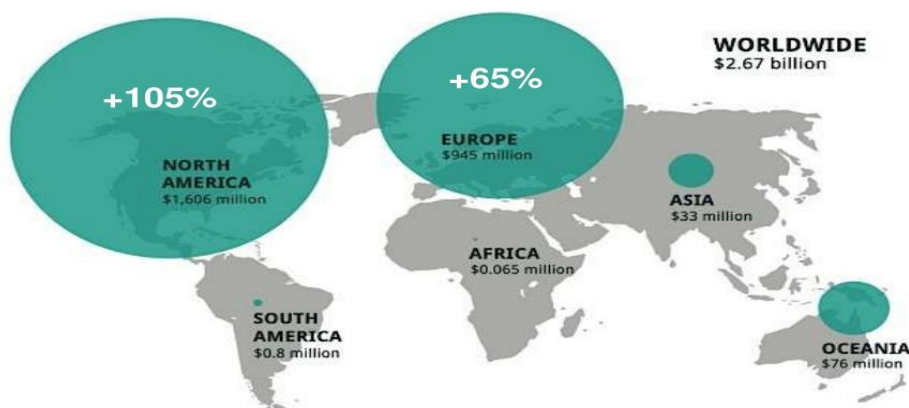
Сурет 1- Әлем бойынша краудфандинг дамуы

4. Инвестиция тартудың басты көзі толық қаржыландыру болып табылады. Яғни, жас кәсіпкер бизнесін бастау үшін толыққанды ақша қаражатын алуын немесе сапасыз бизнес көзін ашуға мүмкіндік бермеу үшін мүлдем қаражат алмауын айтамыз.