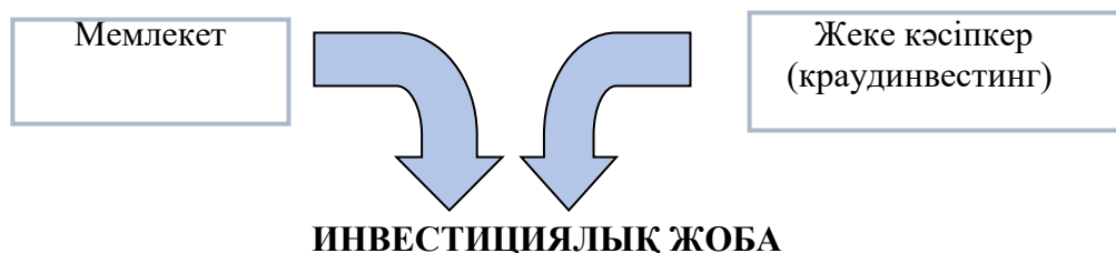
Модель 1 – Инвестициялық жобаларды қаржыландыру моделі №1.