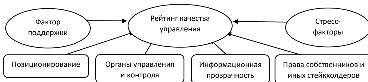
Рисунок 1 - Схема анализа качества корпоративного управления [4]

На рисунке 1 представлена схема анализа качества корпоративного управления.