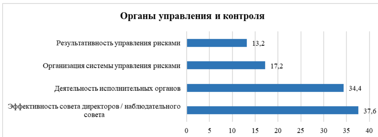
Рисунок 3 - Средневзвешенное значение субфакторов «Органы управления и контроля»

Среди субфакторов «Органы управления и контроля» субфактор «Эффективность Совета директоров или Наблюдательного совета» получил наибольшую оценку и составил 37,6 баллов (рисунок 3). Это говорит о том, что деятельность Наблюдательного совета имеет высокую результативность. Наименьший балл у субфактора «Результативность управления рисками», на что необходимо обратить внимание руководству компании, не смотря на хорошо организованную систему комплаенса.