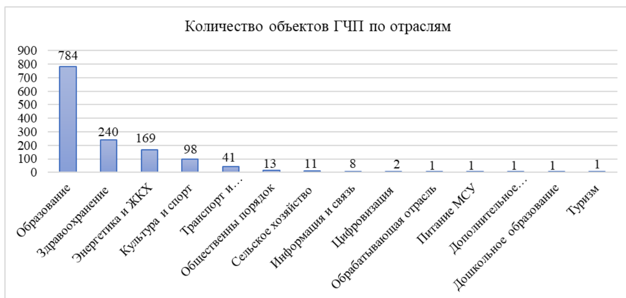
Рисунок 3 – Распределение проектов ГЧП по отраслям экономики на 2025 год

Примечание – Составлено авторами по источнику [20].