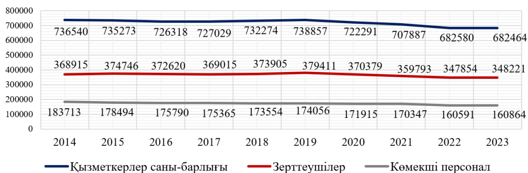
Сурет 3 – Санаттар бойынша ғылыми зерттеулер мен әзірлемелермен айналысатын персонал санатының өзгеруі

Ескерту: ҚР Ұлттық статистика бюросының деректері бойынша https://stat.gov.kz/ru/ авторлармен есептелінді