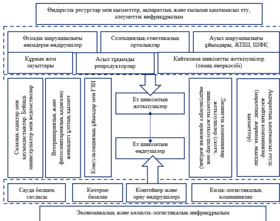
1 сурет - Ет өңдеудің өндірістік құрылымы

Ет өндірісі саласындағы салалық сарапшылар мен бейінді мамандардың арасында барлық ет өңдеу кәсіпорындарын басқарудың қолданыстағы ұйымдық құрылымы икемділіктің, бейімделудің және өзгергіштіктің қажетті қасиеттеріне ие емес деген ұстаным кең таралған, осының бәрі дайын ет өнімдерін өндірудің функционалдық-технологиялық циклінің барлық қатысушыларының мүдделерін іске асыруға синкреттік көзқарасты іске асыруды қамтамасыз етпейді.