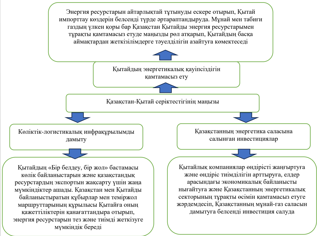
1-сурет – Қазақстан-Қытай серіктестігінің маңыздылығын растайтын негізгі факторлар