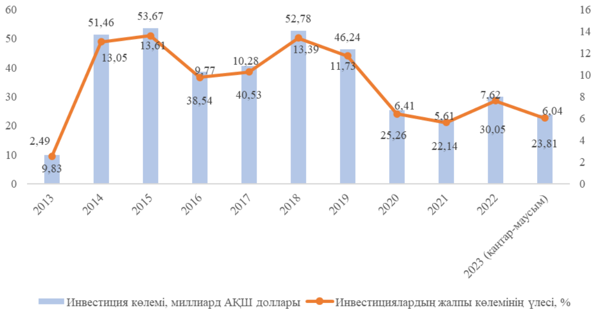
3-сурет – «Бір белдеу – бір жол» жобасы бойынша 2013 жылдан 2023 жылғы маусымға дейінгі Қытай инвестициялары

Ескерту: авторлар дереккөз негізінде құрастырған [15]