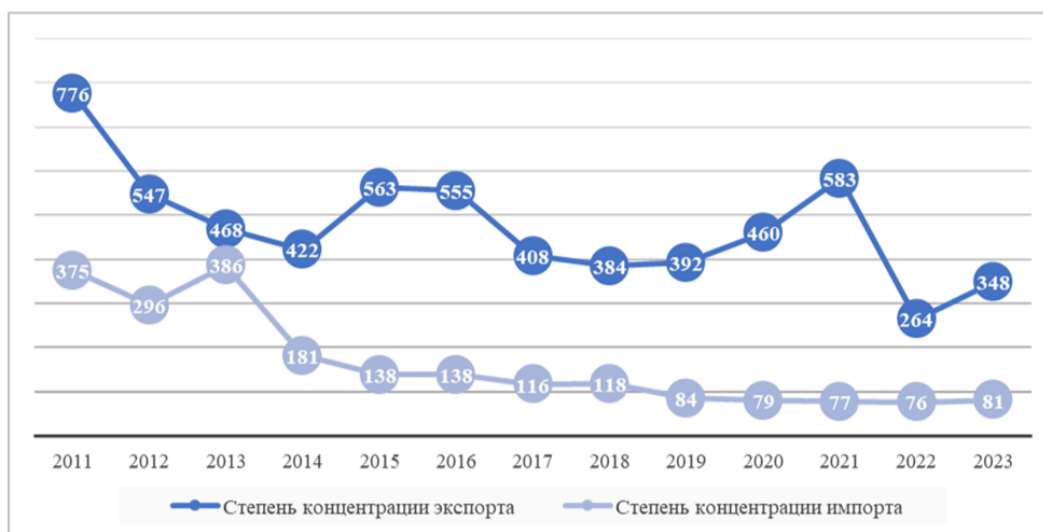
Рисунок 2 – Динамика индекса Херфиндаля-Хиршмана для экспортной и импортной корзины Казахстана с 2011 по 2023 гг.

Примечание: составлено авторами на основе собственных расчетов