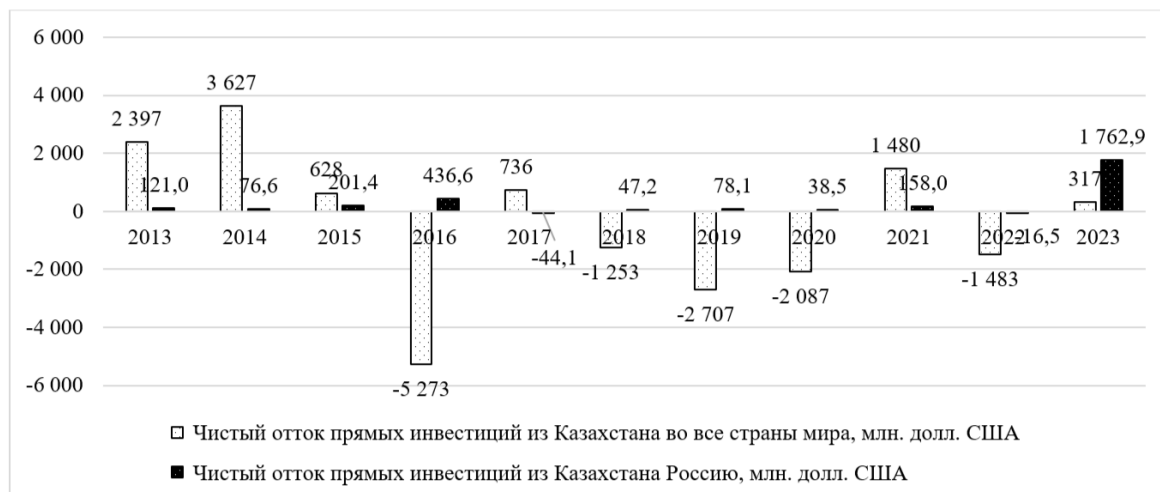
Рисунок 4 – Чистый отток иностранных прямых инвестиций из Казахстана (без реинвестированных доходов) во все страны, в том числе в Россию, в млн. долл. США

Чистый отток иностранных инвестиций из Казахстана в Россию (рисунок 4) имеет отличительный тренд от показателя оттока в страны мира. В целом с 2013 года казахстанские компании вкладывают в Россию (имеется ввиду физический приток денег), за исключением 2017 и 2022 г. 2023 год также был аномальным: казахстанские инвесторы направили в Россию 1,7 млрд. долл. США прямых инвестиций (преимущественно, через долговые инструменты и инструменты участия в капитале).