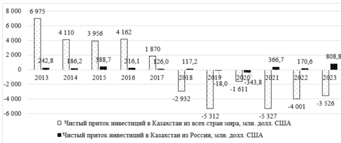
Рисунок 3 – Чистый приток иностранных прямых инвестиций в Казахстан (без реинвестированных доходов) из всех стран, в том числе из России, в млн. долл. США

Казахстан. Аналогичная ситуация наблюдается в отношении чистого притока иностранных прямых инвестиций из России в Казахстан. Однако за последние три года с 2021 по 2023 год включительно данный показатель растет, особенно в 2023 году.