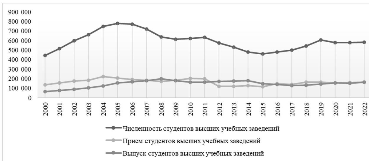
Рисунок 1 - Динамика приема, выпуска и численности студентов вузов

Из анализа динамики численности обучающихся, показанной в рисунке 1, видно, что за последнее несколько лет численность студентов, прием и выпуск практически стабильны, хотя рождаемость в 2000-2010 годы имела четкую динамику роста. Таким образом, часть выпускников среднего образования не рассматривает вузы Казахстана для продолжения обучения.