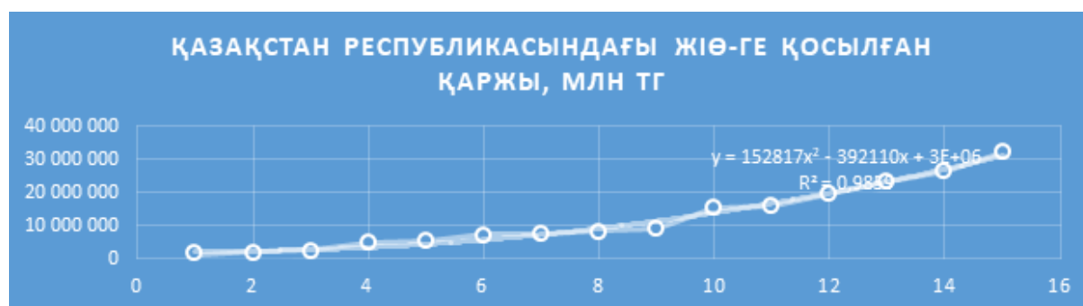
Сурет 2. Қазақстан Республикасының жалпы ішкі өніміне қосқан шағын және орта бизнестің үлесіне арналған 2021, 2022 жылдарға болжам

Жалпы экономика үшін шағын және орта бизнестің қызметі оның икемділігін арттырудың маңызды факторы болып табылады.